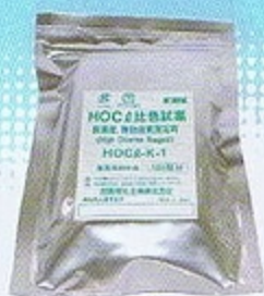
HOC&K-1 有効塩素測定用試薬